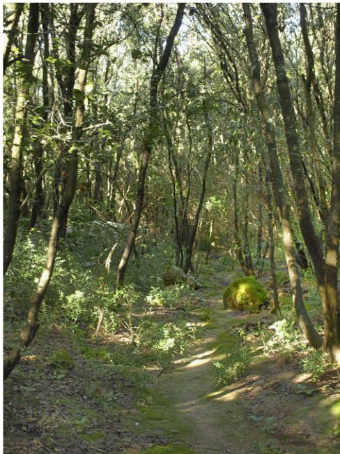
Interno del Canale di S. Martino